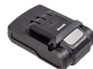
ART. 015-3186-000 Batería 20V - 2000 mAh