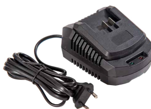
ART. 015-3185-000 Cargador (12-240 V / 50-60 Hz)