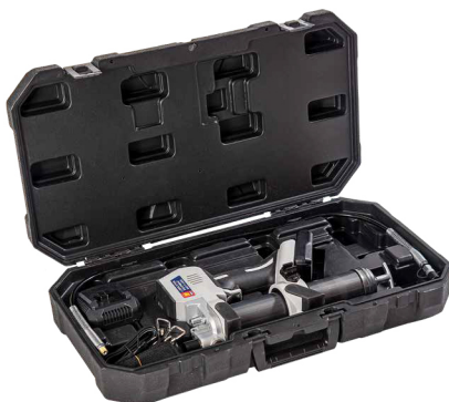
ART. 015-3180-000 El maletín de plástico tiene espacio diseñado para una batería adicional

Diseñada para ser muy versátil y garantizar rendimientos de alta calidad. Es la herramienta ideal para las operaciones de engrase y mantenimiento cotidianas.